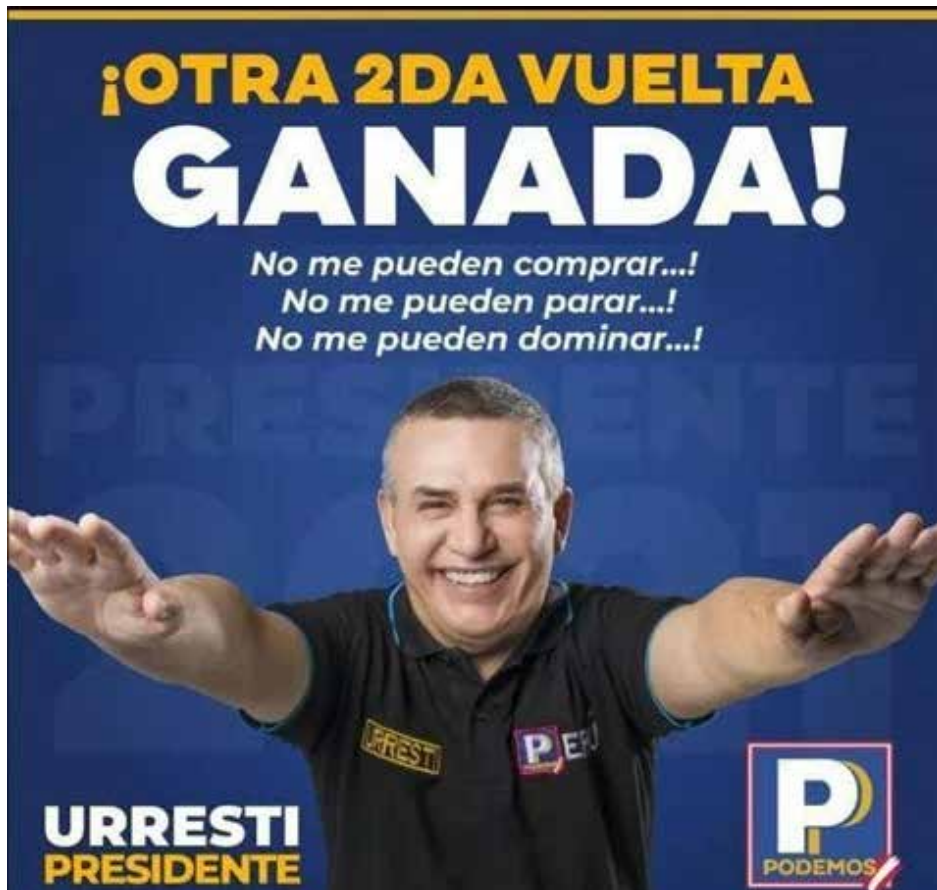
Meme de Urresti, sustituyendo el título de un flyer original

Este meme tiene un formato local y, además, un contenido local. Como el anterior, requiere de contexto específico para ser comprendido. El formato corresponde a una publicidad lanzada por Daniel Urresti luego del debate presidencial de 2021, organizado para la primera vuelta. Luego de haber debatido de forma discreta con varios otros postulantes, se autoproclamó ganador con el título "Otro debate ganado". La publicidad, difundida en las principales redes sociales de Daniel Urresti y de su partido político Podemos Perú, se viralizó rápidamente al ser blanco de diversas burlas, ya que su performance en el debate estuvo lejos de ser la mejor. Asimismo, la publicidad representaba a la perfección la imagen social del candidato: orgulloso, jactancioso, siempre buscando protagonismo. Estas condiciones propiciaron que el formato de la publicidad se hiciera popular y masivo, modificando el contenido de acuerdo a distintas situaciones, políticas o no. En el caso del meme presentado, cuando aún se contaban los votos de la segunda vuelta entre Pedro Castillo y Keiko Fujimori, el meme plantea el imposible e hilarante escenario de Urresti declarándose